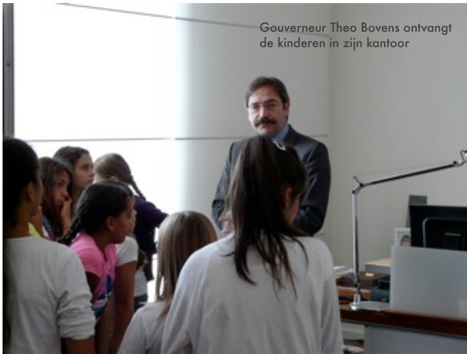
Gouverneur Theo Bovens ontvangt de kinderen in zijn kantoor