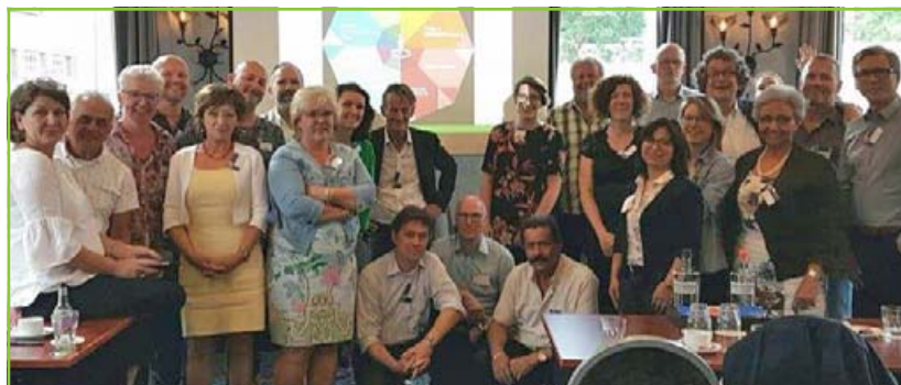
Iedereen in Limburg mag zichzelf zijn

Zowel maatschappelijke organisaties als overheid en bedrijfsleven leveren op de verschillende terreinen van de Inclusiediamant een bijdrage. Welke visie hebben we op diversiteit? Wat zijn goede voorbeelden? Welke partijen acteren binnen de diverse themavelden? Is er bereidheid tot samenwerking en hoe ziet een mogelijke rolverdeling eruit? @