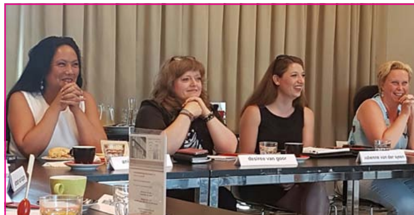
Enthousiast en ambitieus