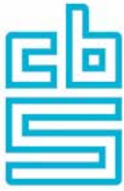
logo van het 'Centraal Bureau voor de Statistiek'

Verder komen veel vluchtelingen uit Afghanistan, Irak, Iran en Somalië.