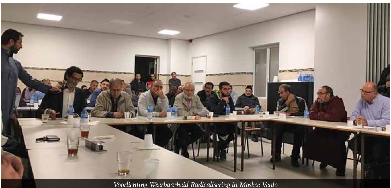
Voorlichting Weerbaarheid Radicalisering in Moskee Venlo